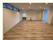
最寄り駅 阪急京都本線 十三駅 阪急神戸線 神崎川駅

児童発達支援・放課後等デイサービス かがや樹 〒532-0035 大阪市淀川区三津屋南2丁目12-8 TEL: 06-6838-3770 FAX: 06-6838-3771 H P: https://team-kagayaki.com/