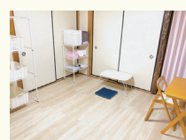
最寄り駅 阪急宝塚線 三国駅 阪急神戸線 神崎川駅

児童発達支援・放課後等デイサービス あるべろ 〒532-0033 大阪市淀川区新高5丁目7-2 TEL: 06-6842-9577 FAX: 06-6842-9595 H P: https://allbero.com/