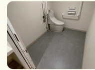
車イス用トイレ完備