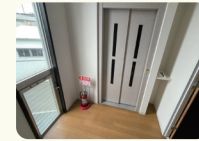
エレベーター完備