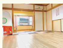
最寄り駅 阪急宝塚線 三国駅 阪急神戸線 神崎川駅

児童発達支援・放課後等デイサービス あるがる 〒532-0032 大阪市淀川区三津屋北2丁目11-19 TEL: 06-6195-9975 FAX: 06-6195-9978 H P: https://arlbre.com/