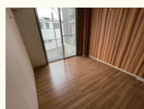
最寄り駅 阪急京都本線 十三駅 阪急神戸線 神崎川駅

児童専門相談支援 こどもみらいSeed 〒532-0035 大阪市淀川区三津屋南2丁目12-8 TEL: 06-6838-3737 FAX: 06-6838-3738 H P: https://seed-soudan.com/